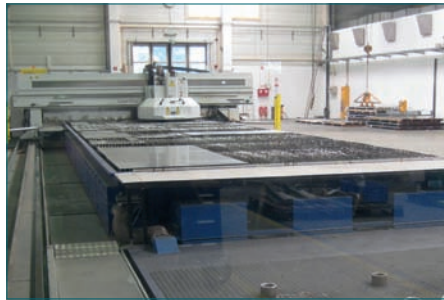
Die Laserschneidanlage wurde auf die Anforderungen von Krones zugeschnitten.

Die Zahl der Anpassungen deutet nicht an, dass die Standardversion des Programms etwa nicht geeignet wäre. Vielmehr ist es so, dass durch die Makros kürzere Lösungswege für ansonsten aufwändigere Operationen realisiert wurden. Lösen ließen sich diese Aufgaben auch in der Standardversion, allerdings mit mehr Aufwand. Es sind viele